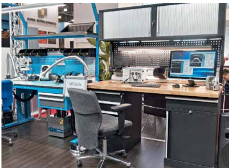
Образцы мебели "Новатор"

Действительно, обычно на постановку производства, которое способно выпускать серьезные объемы качественной продукции, уходят месяцы и годы. Я фактически воплотил свой опыт на новой площадке – ничего не пришлось изобретать. А все остальное стало возможным благодаря высокой квалификации сотрудников. Я привлек лучших специалистов в Санкт-Петербурге, которых только смог