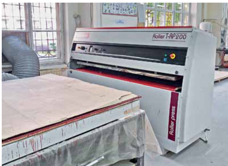
Пресс для ламинирования столешниц

и разнообразные тумбы, шкафы инструментальные и шкафы для раздевалок, верстаки, подкатные тележки, стойки для оборудования, стеллажи – всего порядка сотни позиций. Мы не останавливаемся на достигнутом, у нас хорошие конструкторы, которые практически каждый месяц предлагают что-то новое. Причем речь идет не только о новых изделиях, но и об усовершенствовании отдельных узлов.