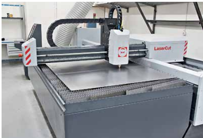
Станок лазерной резки